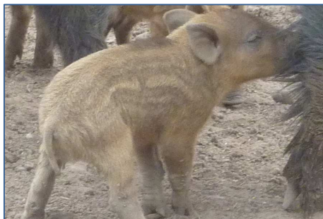
Rayón, cría de jabalí

2003). Al momento de parir, la hembra se aleja del grupo y provee a las crías de un nido tibio formado por distintas hierbas y ramas. Pasados 6 días aproximadamente, vuelve a la piara con sus rayones (SAGPyA, 2007). Estos nacen con pelo y capacidades motoras, justamente porque tienen poco tiempo antes de tener que movilizarse para volver a la piara.